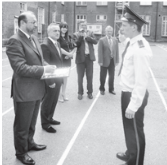
Визит Комиссии ОП РФ во Владикавказский кадетский корпус

В связи с этим 28 мая в г. Владикавказе и 9 июля 2013 г. в Москве Комиссия Общественной палаты Российской Федерации по проблемам национальной безопасности и социально-экономическим условиям жизни военнослужащих, членов их семей и ветеранов под руководством ее председателя, выпускника Орджоникидзевского ВОКУ 1977 г. А.Н. Каньшина, с привлечением широкого круга экспертов и специалистов, провела общественные слушания по вопросу: «Об общественной поддержке воссоздания Северо-Кавказского суворовского военного училища», по итогам которых обратилась к министру обороны Российской Федерации С.К. Шойгу с предложением, руководствуясь указаниями Президента Российской Федерации от 5 июля 2013 г. по повышению качества допризывной и довузовской подготовки молодежи, рассмотреть вопрос восстановления в г. Владикавказе (Республика Северная Осетия – Алания) Северо-Кавказского суворовского