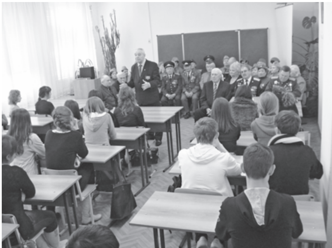
Знать правду о войне: «Урок мужества» в школе To know the truth about the war: “Lesson of courage” at school

бование обязательного рецензирования экспертами научной, учебно-методической и творческой продукции (на исторической основе), формирующей общероссийскую историческую культуру, мировоззрение российского общества. Причем заключения экспертов представляются имеющими не цензурный характер (разрешать или запрещать выход в свет), а сопроводительно-рекомендательный, с размещением соответствующей информации на обложке, авантитуле продукции и т.п. Административная ответственность за выполнение данного требования при этом возлагается как на автора, так и производителя (издательство, типографию, киностудию, телеканал и т.п.).