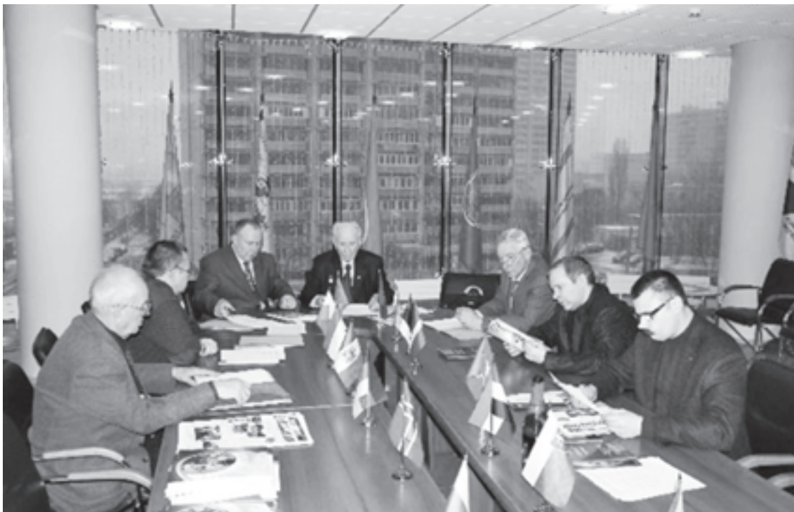
Заседание Военно-философского общества Meeting of the Military philosophic society