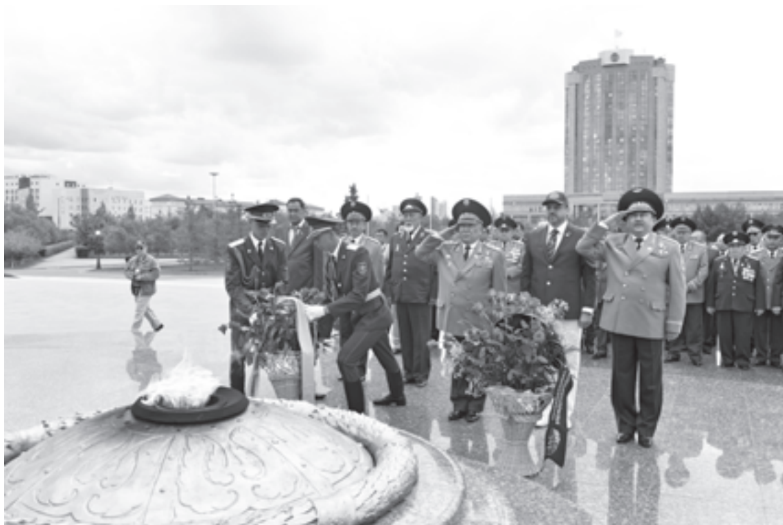
Дружба, скрепленная в боях. Астана, июль 2013 г. Friendship, enforced in battles. Astana, July 2013.

ров запаса, независимо от блоковой ориентации, социально-экономического положения и конфессиональной принадлежности.