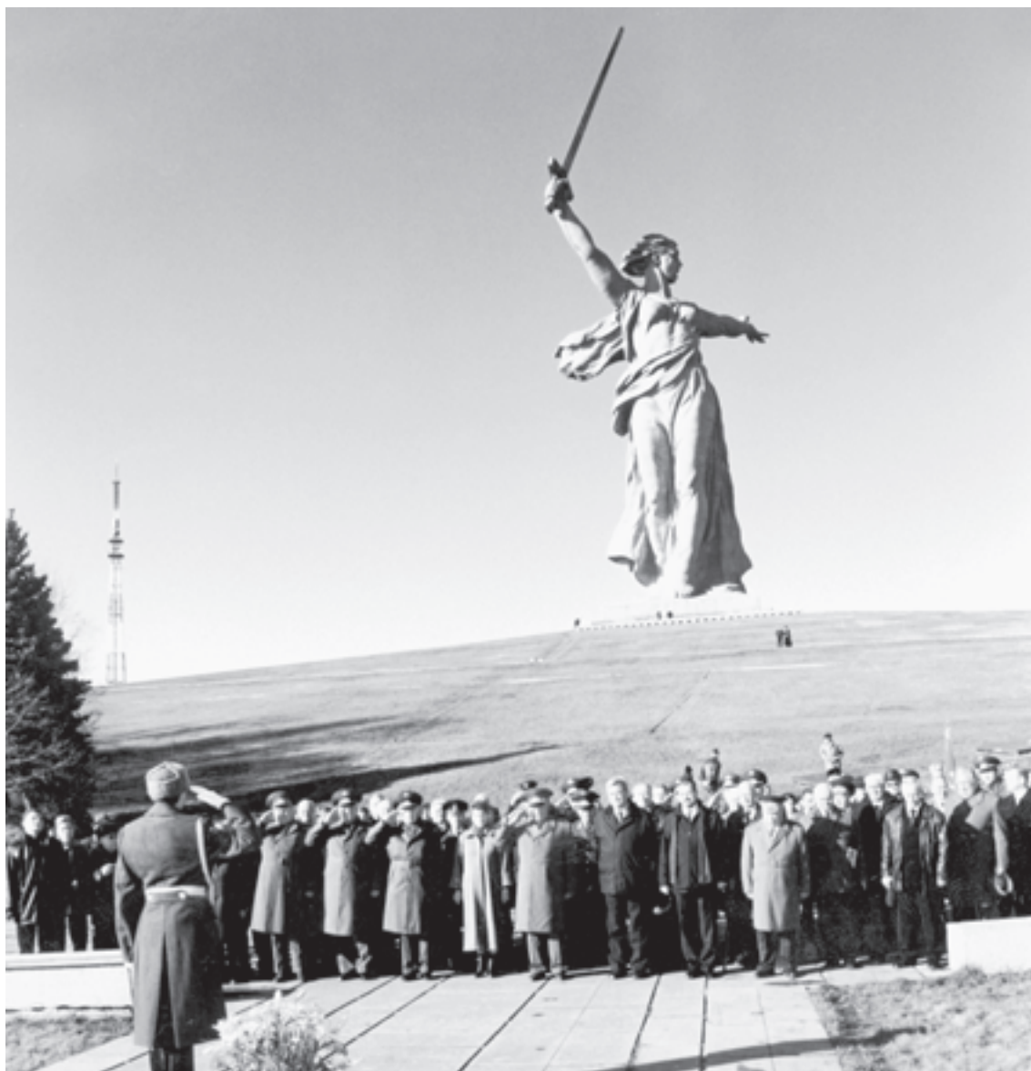
Делегация Национальной Ассоциации «Мегапир» на Мамаевом кургане Delegation of the National Association "Megapir" at Mamayev Kurgan

planned for decades to come! Without patriotism a state cannot be saved, and for those, who are engaged in politics, who are now in power, this is what is necessary to know like the multiplication table. They should think more about the Motherland, and not about the rest in different "Courchevels"! Those, who do not understand their duty to the Fatherland, have no moral rights to be a leader, even in a small affair.