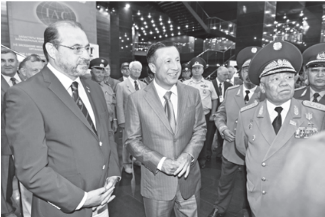
Во время встречи с министром обороны Республики Казахстан А.Р. Джаксыбековым (в центре) During a meeting with Minister of Defense of the Republic of Kazakhstan A.R. Dzhasybekov (in the middle)

ны ЦАХАЛ (ZDVO)» и «Ассоциация ветеранов войны Армии обороны Израиля» «TZEVET» (Израиль), «Ассоциация ветеранов и резервистов обороны и безопасности Республики Македония» (Республика Македония), «Организация ветеранов Республики Сербской» (Республика Сербия), «Общество военных пенсионеров Черногории» (Республика Черногория).