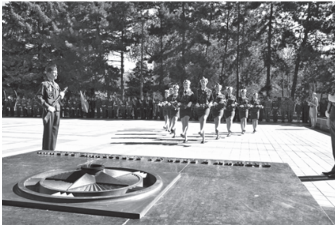
Торжественные мероприятия в честь Дня Победы у Вечного огня г. Пятигорска Solemn events dedicated to the Victory Day held at the Eternal Flame in Pyatigorsk

стояния, независимости, территориальной целостности и культуры.