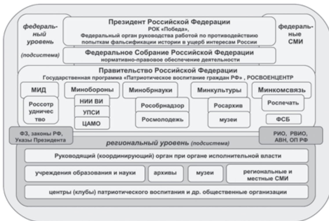
Рис. Принципиальная схема государственной системы противодействия попыткам фальсификации и искажению истории в ущерб интересам России

In general, it may be quite reasonable to note that in the Russian Federation since the 2009-2010 there has been activation of the process of creating a system to counter the attempts to falsify and distort history to the detriment of Russia's interests, which began in the mid -1990s. As of today, components of the system being formed are operating at the federal, regional and municipal level; various forms of both preventive (educational) work and measures for rapid response to the attempts of falsification and distortion of history have been tested; the Russian government and society to adequately assess the threats to national security posed by falsifiers of